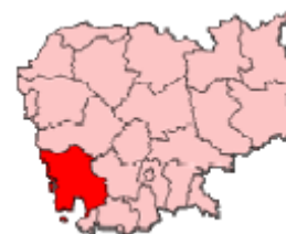
Figura 7: Información general

Koh Kong se encuentra al sudoeste de la costa camboyana en la frontera con Tailandia. Su capital es Krong Koh Kong. El desplazamiento a Koh Kong se realiza en barca de Sihanoukville a Koh Kong (crucero de cuatro horas), o por carretera (unas siete horas), desde Phnom Penh o Sihanoukville. La economía local se basaba en la pesca, pero esta industria ha sufrido un importante declive desde 1998, y ha sido sustituida desde entonces por la explotación forestal. El desarrollo económico se fundamenta en el comercio fronterizo (incluido el contrabando) y el turismo (ecoturismo en las zonas forestales circundantes y en los casinos) para atraer a visitantes occidentales y tailandeses. Pese a encontrarse en una situación similar a Poipet (comercio fronterizo, contrabando, casinos), Koh Kong no ha experimentado en el mismo grado los efectos secundarios negativos (comunidades callejeras, barracas, etc.) observados en Poipet. La provincia, escasamente poblada, que presentaba bajos indicadores de desarrollo, se subdivide en ocho distritos.