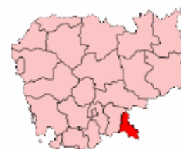
Figura 1: Información general

Svay Rieng está situado al sudeste de Camboya a orillas del río Vai Kou. Está comunicada con Phnom Penh, Vietnam, y las áreas cercanas por una autopista nacional. La región circundante destaca por sus recursos agrarios: se cultiva arroz, patatas, plátanos, maíz, moras y algodón. La provincia se subdivide en siete distritos.