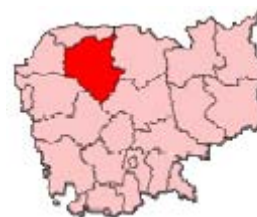
Figura 4: Información general

Siem Reap es una provincia situada al noroeste de Camboya a orillas del lago Tonle Sap. La capital de la provincia recibe también el nombre de Siem Reap. Se trata del principal destino turístico de Camboya, pues es la ciudad más cercana a los templos de Angkor, entre los que destaca Angkor Wat, el más célebre, que atrae las mayores cifras de turistas. Recientemente, la ciudad ha experimentado una enorme expansión, con centenares de hoteles, restaurantes y comercios abiertos para mantener tanto a los turistas internacionales como a los camboyanos. Otros sitios de interés cerca de Siem Reap incluyen Angkor Thom, Banteay Srei, Ta Prohm, así como centenares de otras ruinas de templos. La provincia se subdivide en 12 distritos.